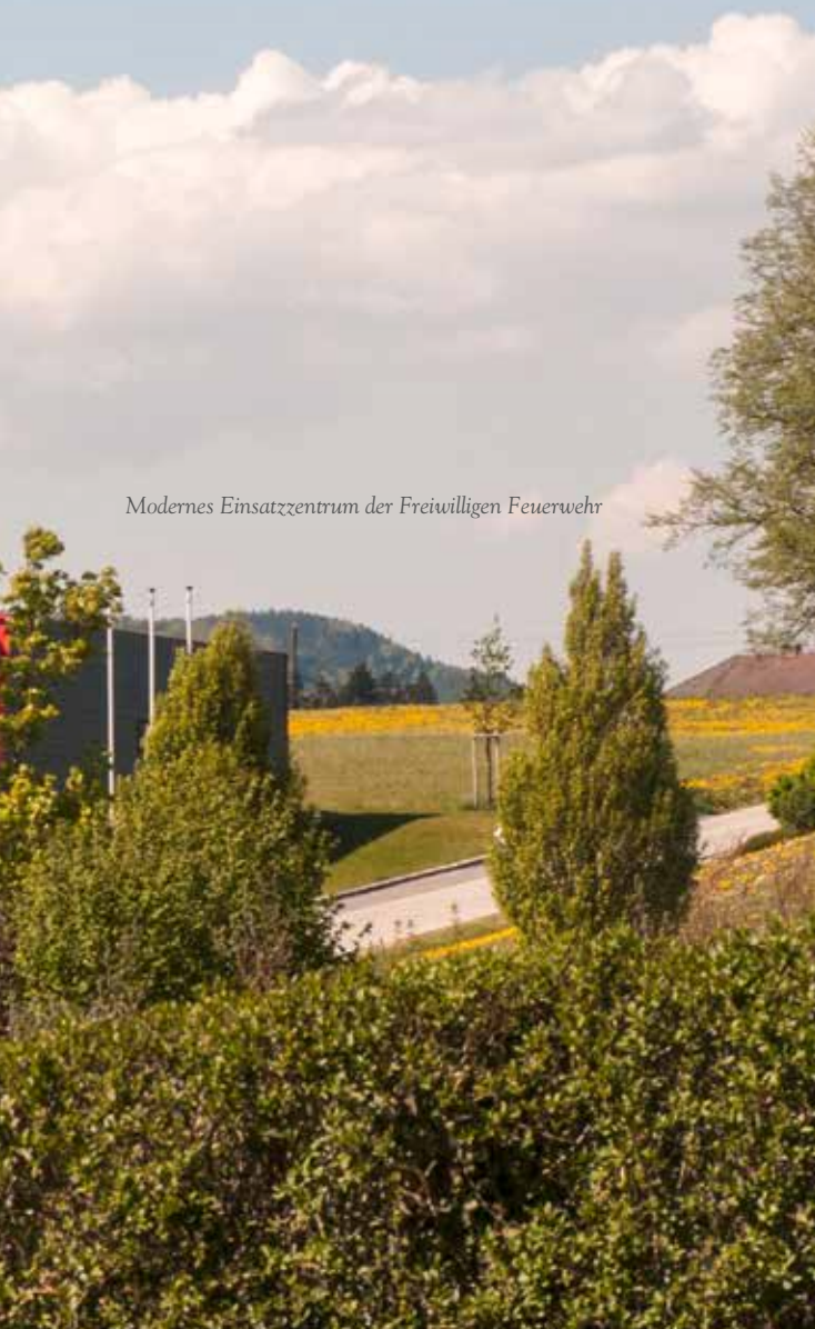
Modernes Einsatzzentrum der Freiwilligen Feuerwehr

Sicherheit ist vor allem für das tägliche Zusammenleben sehr wichtig. Dafür sorgen unsere Feuerwehr im Katastrophenfall, unser Bundesausbildungszentrum der Diensthunde, die Bundesbetreuungsstelle für Asylsuchende, sowie die Polizeidienststellen in den Nachbargemeinden. Damit wird das Miteinander aller Bevölkerungsgruppen in unserer Gemeinde unterstützt und gewährleistet.