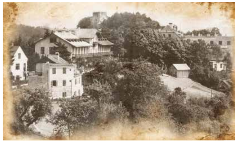
Bad Kreuzen 1929