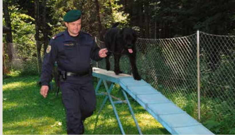
Diensthundausbildungszentrum in der Bundesbetreuungsstelle