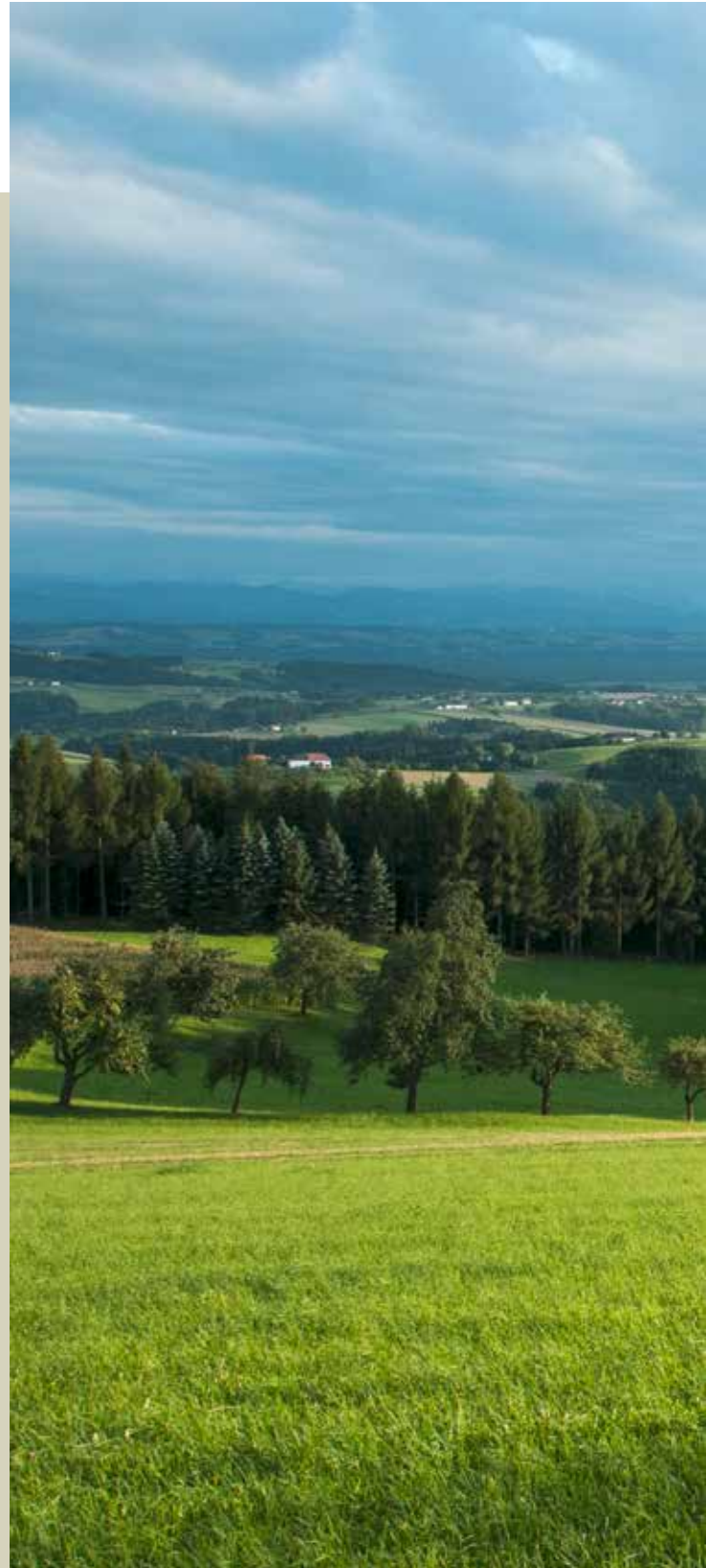
Regionale Landwirtschaft mit schonender Nutzung der Ressourcen

Die Erhaltung und positive Weiterentwicklung unserer Landwirtschaft spielt eine zentrale Rolle in unserer Gemeinde. Der strukturelle Wandel der letzten Jahre und in Zukunft wird nicht als Gefahr, sondern als Chance gesehen, die es zu gestalten gilt.