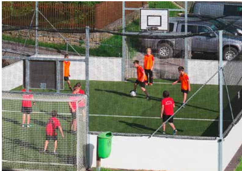
Spiel und Action im neuen Funcourt

Die verschiedenen Vereine in Bad Kreuzen ermöglichen ein vielfältiges Freizeitangebot. Sie sind für einen großen Teil der Bevölkerung ein sehr wichtiger, sozialer Kontakt, der für eine I(i)ebenswerte Gemeinde besonders wichtig ist. Die dafür nötige Infrastruktur wurde in den letzten Jahrzehnten für die unterschiedlichsten Bereiche geschaffen und wird entsprechend erhalten und weiter entwickelt. Damit wird ein reges Vereinsleben auch in der Zukunft gesichert.