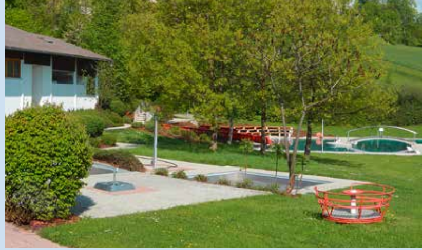
Freizeitzentrum mit Freibad und Tennishalle