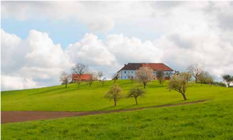
Vierkanthöfe prägen das Landschaftsbild

Das Leben in den bäuerlichen Familien ist mehr als eine Tradition. Es bedeutet eine Einheit von Mensch, Tier und Natur. Das Zusammenleben mehrerer Generationen unter einem Dach ist noch immer Realität. Der Bauernhof ist Arbeitsplatz und Lebensraum zugleich.