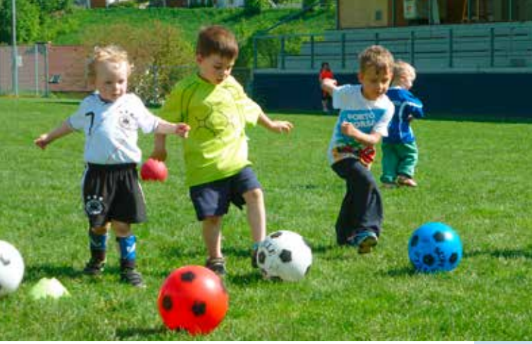
Sportanlagen für sinnvolle Freizeitgestaltung in jedem Alter