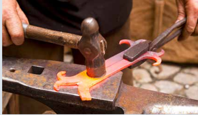
Gewerbebetriebe sind das Rückgrat der heimischen Wirtschaft