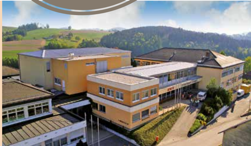
Neue Sportmittelschule Bad Kreuzen