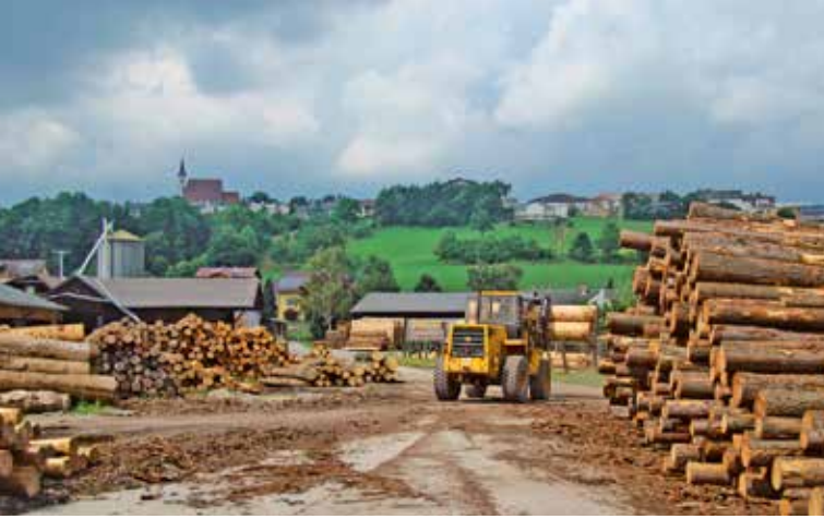
Rohstoff Holz als wichtiger Wirtschaftsfaktor

Gemeinsame Anstrengungen mit den dafür verantwortlichen Stellen sind die Basis, um Bad Kreuzen als weithin bekannte und geschätzte Tourismusgemeinde zu etablieren.