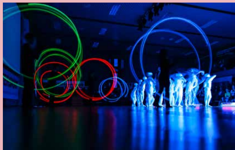
Effektvolle Darbietung beim Schauturnen 2013