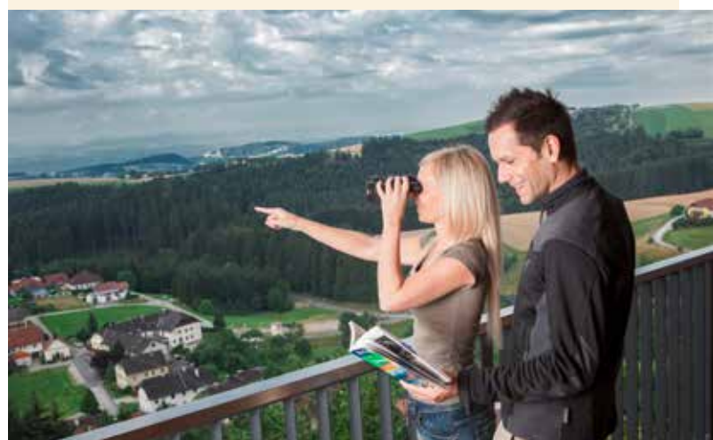
Blick von der Schatz.Kammer Burg Kreuzen

Ca. 120 km langes Straßennetz (davon 105 km Gemeindestraßen bzw. landw. Güterwege) sowie 130 km beschilderte und betreute Wanderwege.