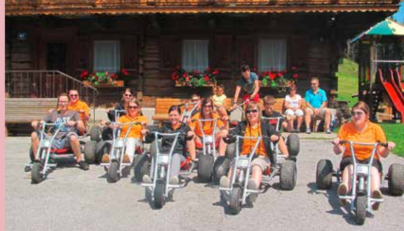
Aktive Landjugend Bad Kreuzen beim Vereinsausflug