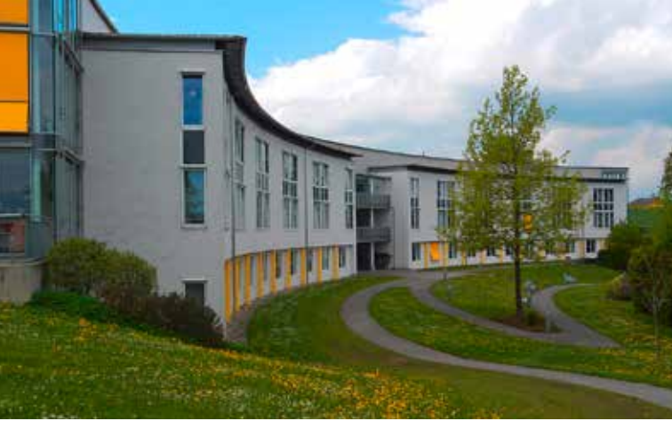
Seniorium des SHV Perg

Als Standort eines Seniorenheimes im Bezirk Perg nutzt Bad Kreuzen seine gestaltende Rolle und bietet den Bewohnern professionelle Pflege und Unterstützung im Alltag.