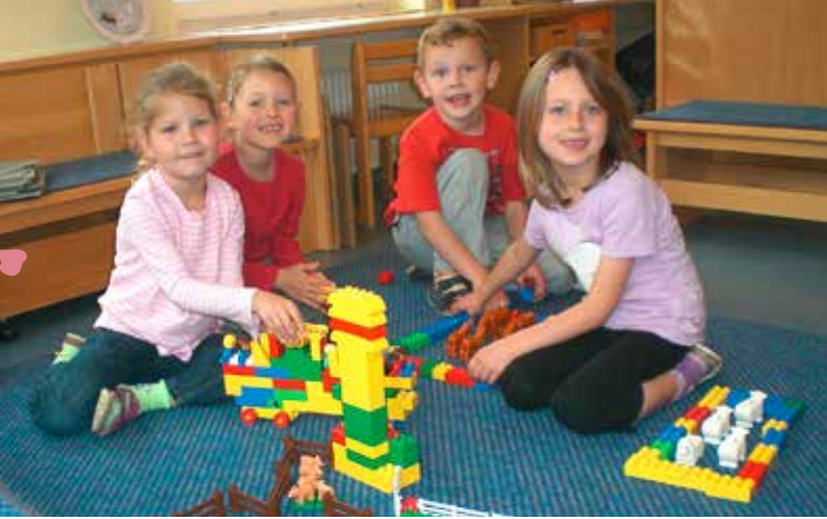
Der Kindergarten in Bad Kreuzen wird gerne besucht.

Der aktive Kontakt zu den Jugendlichen, die zur Ausbildung in die Zentralräume gehen, spielt eine wichtige Rolle. Den gilt es zu gestalten und regelmäßig zu pflegen. Darüber hinaus ist der aktive Kontakt zur Jugendarbeit in den Vereinen und generell zu unseren Jugendlichen sehr wichtig, damit alle die Wertschätzung und Zugehörigkeit zur Gemeinde spüren können.