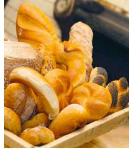
Handwerk über Generationen

Dazu ist eine gepflegte Kulturlandschaft, bestens erhaltene Infrastruktur und neues, zusätzliches Angebot die Voraussetzung.