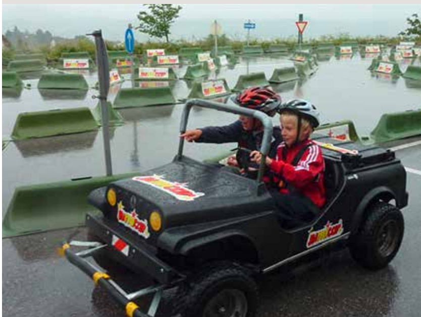
Verkehrssicherheitstraining für VolksschülerInnen